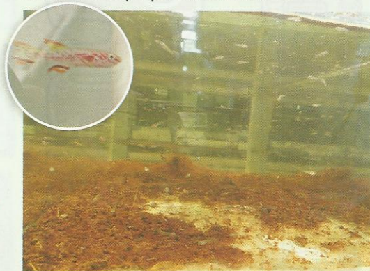
Killies jovens permanecem em aquários separados No destaque: Os killiefishes machos são mais coloridos que as fêmeas

Zé conta que se interessou pelo killie por seu comportamento interessante, bem como a facilidade de reproduzir o seu ambiente natural. Como são peixes que vivem em poças de água em climas do semiárido, tanto brasileiro quanto africano, estão acostumados aos pequenos ambientes.